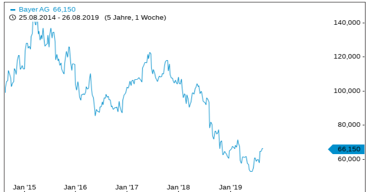
Chartverlauf der letzten 5 Jahre

Historische Renditen und historische Kursentwicklungen sind kein verlässlicher Indikator für künftige Renditen und zukünftige Kursentwicklungen.