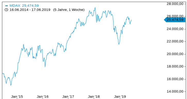
Chartverlauf der letzten 5 Jahre

Historische Renditen und historische Kursentwicklungen sind kein verlässlicher Indikator für künftige Renditen und zukünftige Kursentwicklungen.