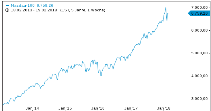
Chartverlauf der letzten 5 Jahre

Historische Renditen und historische Kursentwicklungen sind kein verlässlicher Indikator für künftige Renditen und zukünftige Kursentwicklungen.