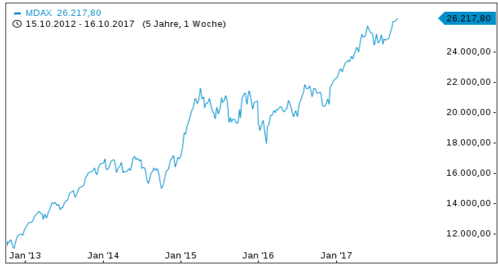
Chartverlauf der letzten 5 Jahre

Historische Renditen und historische Kursentwicklungen sind kein verlässlicher Indikator für künftige Renditen und zukünftige Kursentwicklungen.