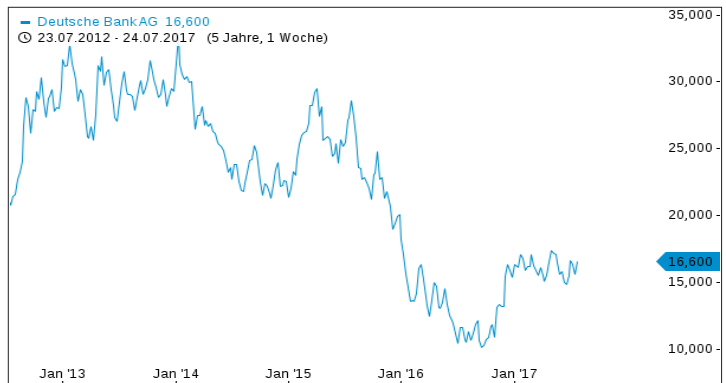
Chartverlauf der letzten 5 Jahre

Historische Renditen und historische Kursentwicklungen sind kein verlässlicher Indikator für künftige Renditen und zukünftige Kursentwicklungen.